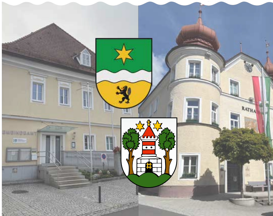
Fotos und Wappen: Marktgemeinde Vorderweissenbach und Stadtgemeinde Bad Leonfelden