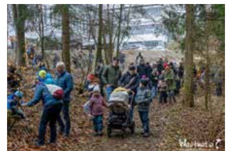
Text: Sternstoa Teifin