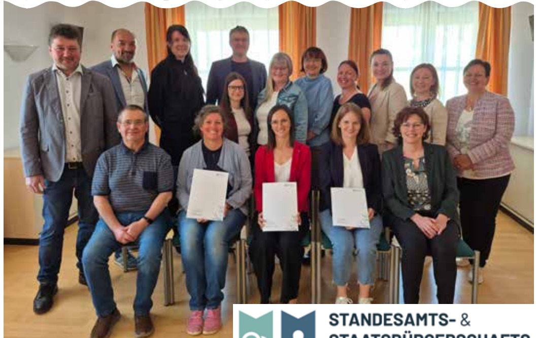
Fotos und Text: Standesamts- und Staatsbürgerschaftsverband Sterngartl