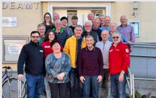
Text und Foto: Österreichisches Rotes Kreuz (Bezirksstelle Freistadt & Urfahr-Umgebung)