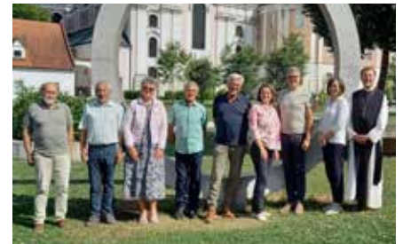
Projektgruppe Wilheringer Weg

wichtige Informationen über den Weg, die Impulse, Nächtigungsmöglichkeiten etc. Impulstafeln bei jeder Kirche bieten die Möglichkeit zum Download der Audioimpulse in Deutsch/Tschechisch/Englisch.