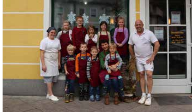
Text und Fotos: Kindergarten Regenbogen