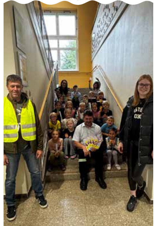
1B der Volksschule Vorderweissenbach

Fotos und Text: Marktgemeinde Vorderweissenbach