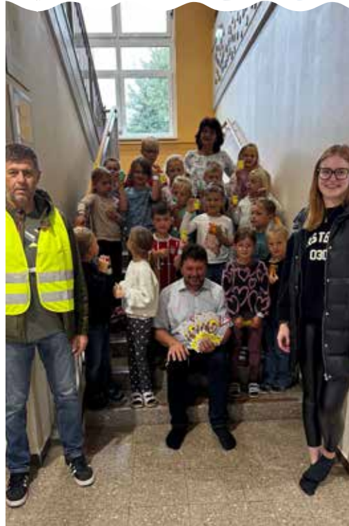
1A der Volksschule Vorderweissenbach