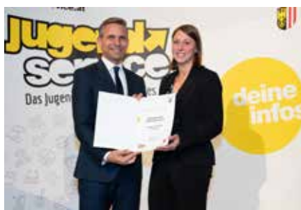
Text: Jugendausschuss Mgd. Vwb

Die Marktgemeinde Vorderweissenbach konnte die Auszeichnung bereits zum sechsten Mal erreichen.