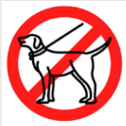
Grafik und Text: Weichselbaumer M.