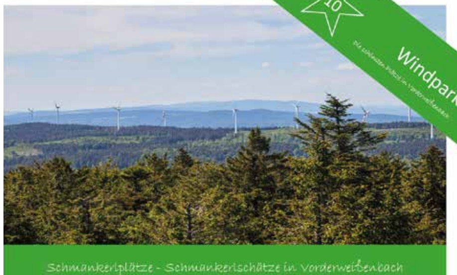
Schmankerlplätze - Schmankerlischätze in Vorderweißenbach

Im Sternwald sorgt der größte Windpark Oberösterreichs mit 9 Windkraftanlagen seit dem Jahr 2003 für umweltfreundliche Stromerzeugung. Windparkführungen sind jederzeit bei Herrn Franz Maureder (0664 65 53 901) möglich. An diesem Schmauskehlplatz befindet sich der Wanderweg Nr. 43a „Windparkrunde“ (Ausgangspunkt Parkplatz Sternwald) sowie der Wanderweg Nr. V5 „Windparkweg“ (Ausgangspunkt Hotel Guglwald). Für diese zwei Wanderwege gibt es auch einen Verbindungsweg (siehe Beschilderung direkt bei den Wanderwegen).