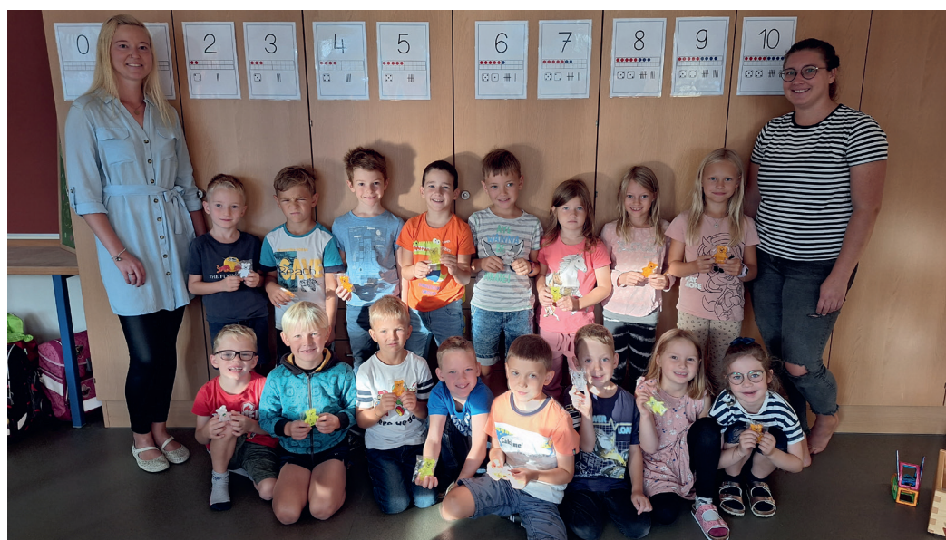
Am Bild zu sehen ist die Klasse 1b der Volksschule Vorderweissenbach.

Heuer besuchen 33 Kinder unsere ersten Klassen der Volksschule Vorderweissenbach.