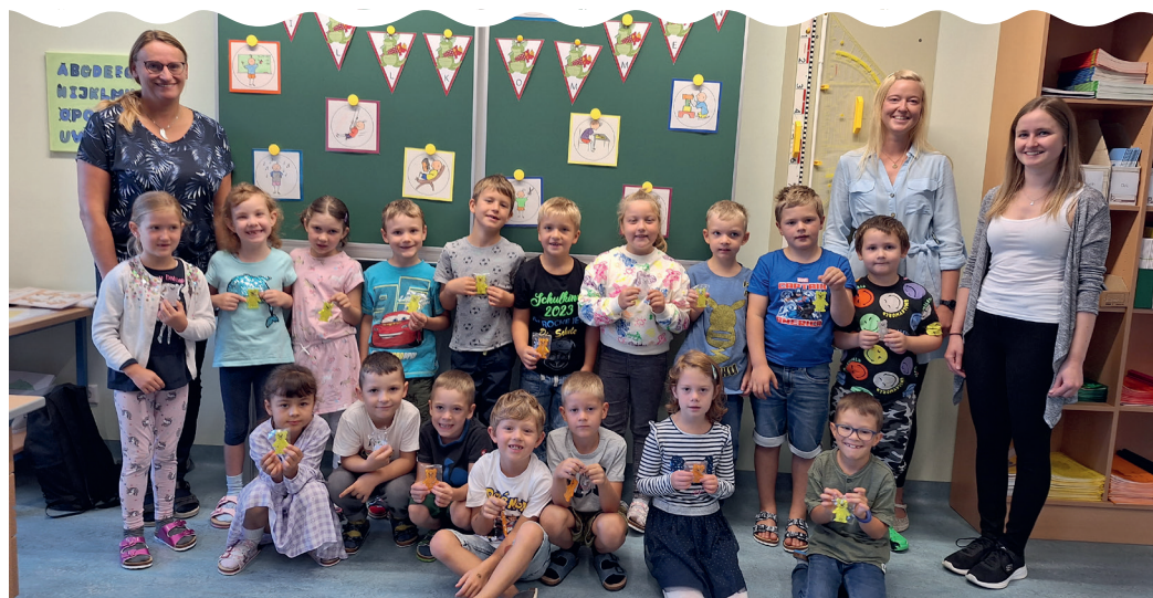
Am Bild zu sehen ist die Klasse 1a der Volksschule Vorderweissenbach.

Amtliche Mitteilung Zugestellt durch Österreichische Post