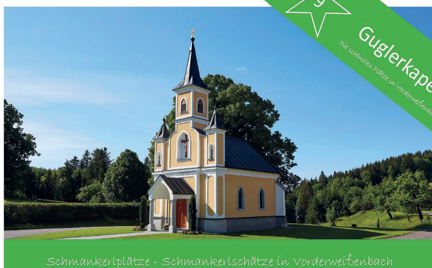
Schmankerlplätze - Schmankerschätze in Vorderweißbach

( www.vorderweissenbach.at/service/jobangebote )