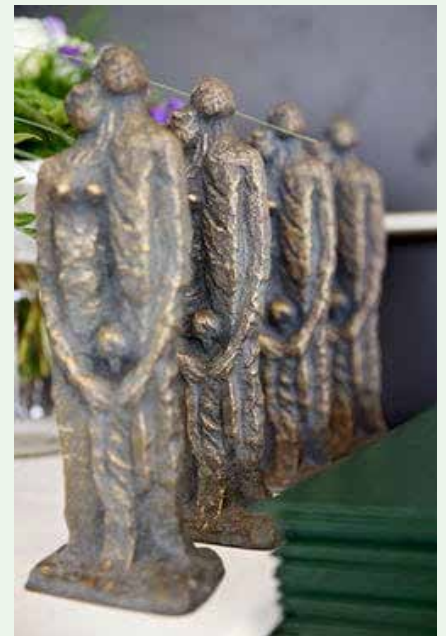
Auszeichnung „Felix Familia“