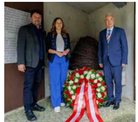
Text: BKA

Bis ins Jahr 1989 wurde Europa durch den Eisernen Vorhang in zwei Teile getrennt. Der Grenzverlauf verlief genau entlang der Grenze Österreichs, unter anderem im Mühlviertel. Stacheldrahtsperrungen, Minen und elektrisch geladene Zäune machten das Überschreiten der Grenze unmöglich. Dieses dunkle Kapitel der europäischen Geschichte ist vielen jungen Menschen gar nicht mehr bewusst. Der DenkStein in Guglwald steht als mahnendes Artefakt für diese düstere Zeit. Der Verein „DenkStein Eiserner Vorhang“ lud gemeinsam mit Jugendstaatssekretärin Claudia Plakolm zur Kranzniederlegung ein.